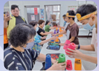
基隆 / 日照中心兒老共學 據點青少兒到社區為長輩表演、教導輩疊杯