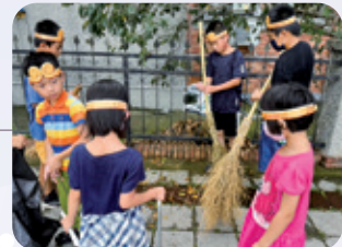
南投 / 社區環保與資源回收 帶領兒少社區服務，進行環境保護及回收再利用