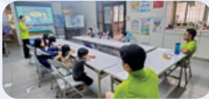
桃園 / 偏鄉營隊服務 霸凌防制 / 情緒教育，帶領青少兒打擊各種情緒的腦補怪