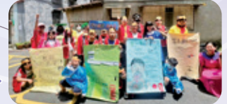
古亭 / 社區環境教育宣導 據點青少兒進行社區走動式環境教育宣導