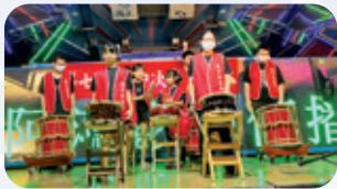
新市 / 社區公益表演 兒少至社區中秋晚會公益表演，帶給社區幸福與歡樂