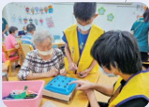
關廟 / 社區老人服務 兒少帶領長輩進行手作 DIY 與團康活動