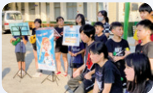
歸仁 / 反霸凌宣導 & 公益表演 以孫悟空做為兒少崇拜的英雄，展開校園反霸凌音樂劇