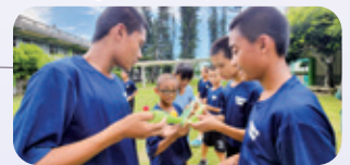
台東 / 偏鄉營隊服務 情緒教育 / 情感教育 / 生命教育 / 品格教育，帶領青少年累積實踐夢想的能力