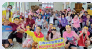
彰化 / CRC 表意權宣導 帶領兒少至社區表演戲劇、獨輪車、烏克麗麗、陶笛、拇指琴