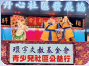
新莊 / 布袋戲公演 學習布袋戲製偶、操偶、口白，並進行社區公演，與社區長者共學同樂