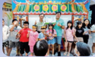
萬華 / 皮影戲公演 青少兒學習皮影戲，並在社區進行公演，兒老同樂