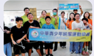
宜蘭 / 偏鄉營隊服務 霸凌防制 / 情緒教育，帶領青少兒打擊各種情緒的腦補怪