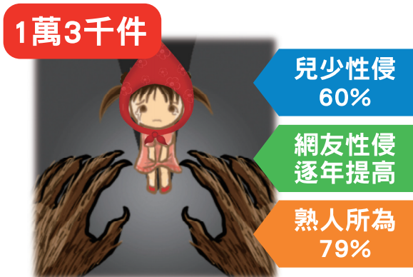
▲ 2016性侵通報案件(衛福部保護司統計)

除了校園宣導，純潔協會更在雲林、南投與屏東等偏鄉之學校與社區設立近30個弱勢兒少課輔班，本次慈善義演捐款所得將全數用於課輔照顧、品格教育及愛心晚餐上，如此有意義的活動需要您更多的支持與響應。